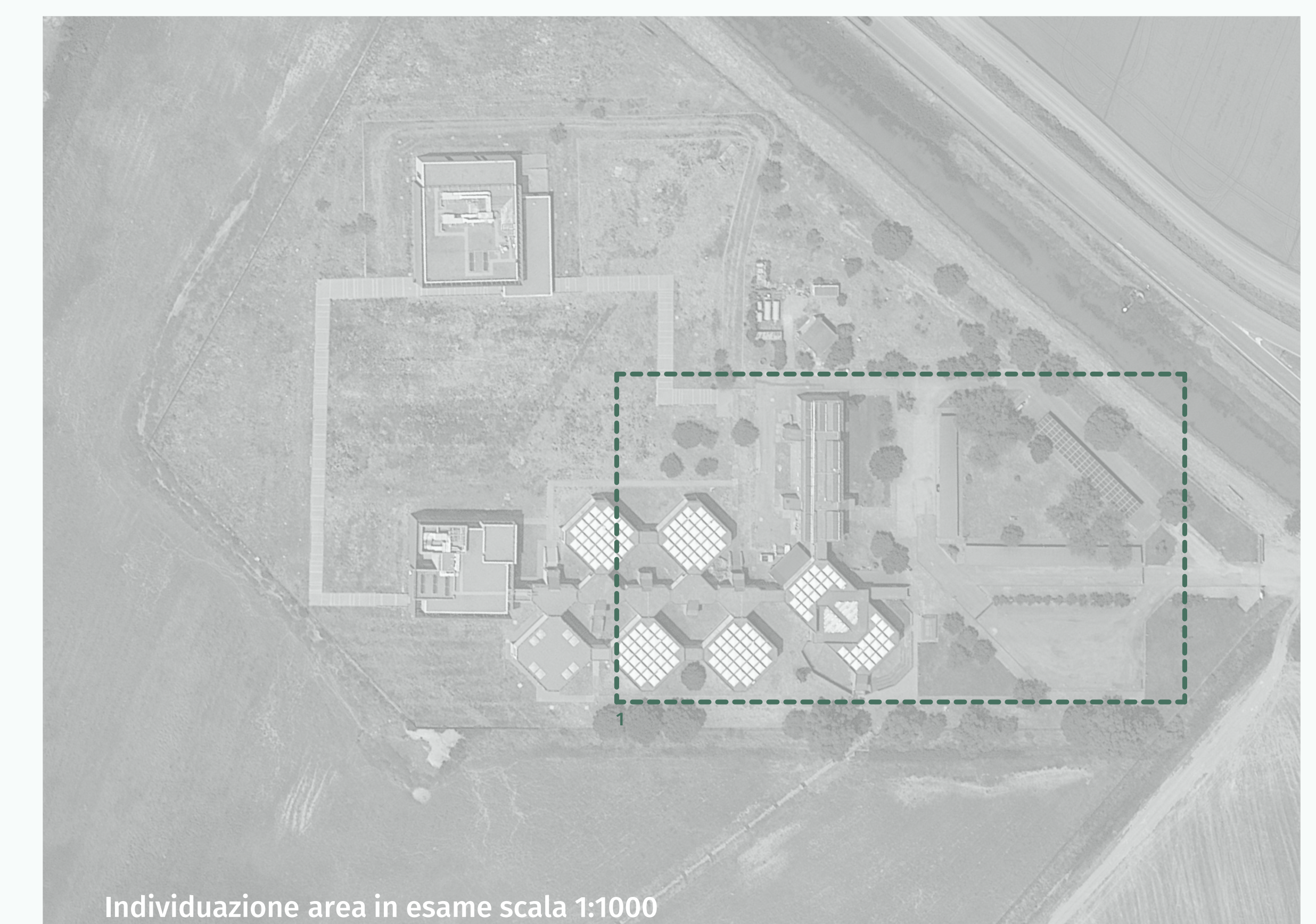
Individuazione area in esame scala 1:1000