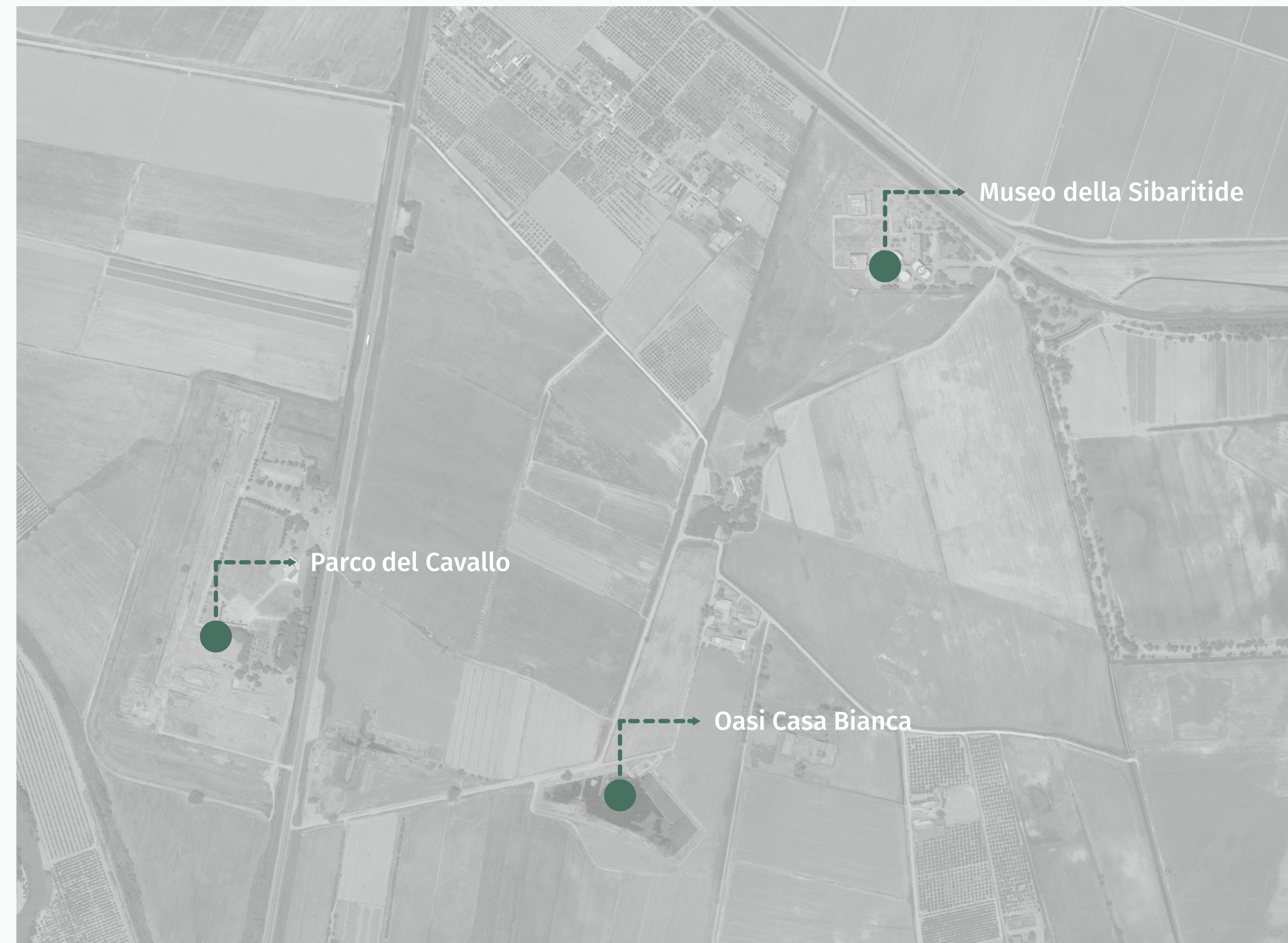
Inquadramento territoriale scala 1:5000